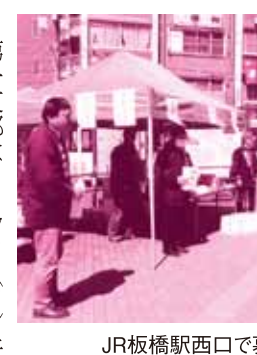
JR板橋駅西口で募金活動

また、毎週第三日曜日に朝市にきている福島の白川が被害にあったという事で、すぐに支部からお見舞金として、10万円送りました。