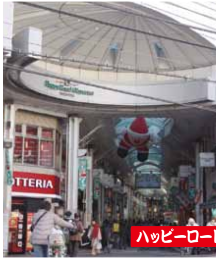
ハッピーロード大山商店街(振)