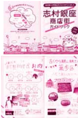
カラー印刷の為、見やすいレイアウトです

制作をした小学生たちが街頭に立ち一日 で配布し宣伝してくれたお陰で子ども達と お店が身近になり販売効果はさらに促進さ れました。