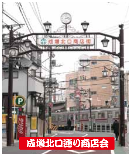
成増北口通り商店会