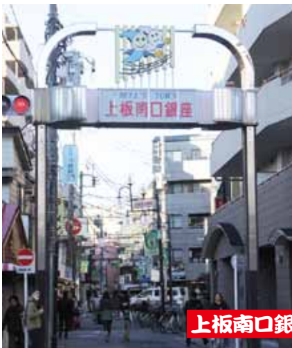
上板南口銀座商店街(振)