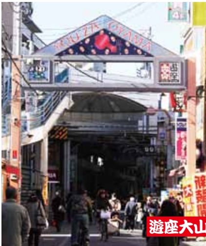
遊座大山商店街(振)