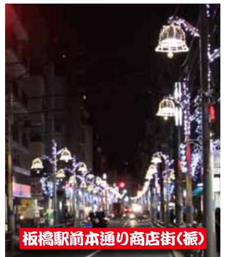
板橋駅前本通り商店街(振)