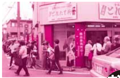
上板橋南口 とれたて村

今回のプレミアム付お買物券は政府の景気対策として、事業経費は全国の自治体に全額交付金として支給され、それぞれが工夫して実施するもので、板橋区商連は2割のプレミアムを付けて、発行総額15億円、発行冊数12万5千冊、300万枚という過去に例のない大量、多額の商品券を発行することになりました。 また、75歳以上の高齢者、重度の心身障害者また要介護4度5度の方などは、ハガキで事前申し込みができるようにしたほか、子育て世代の方々のためには赤ちゃんも一人5万円の対象とし、年齢制限をなくしました。 こうして、6月18日(木)発売の6会場は午前10時の発売なのに6時頃から並ぶ人もいて6か所の販売会場の全てが、午前中に完売しました。 続いて、ここがメインとなる21日(日)の11会場での総額5億9千万円は、若干売れ残りりましたが最終日の28日(日)の7会場ですべて完売することができました。