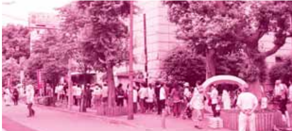
常盤台地域センター