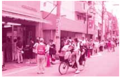
中板橋商店街事務所