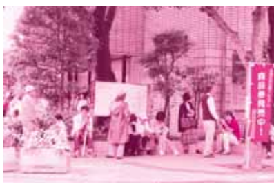
大谷口地域センター