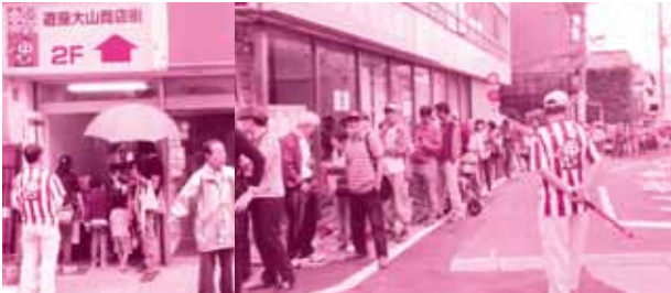
遊座大山商店街事務所