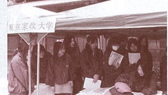
家政大女子学生によるやさしい健康アドバイス