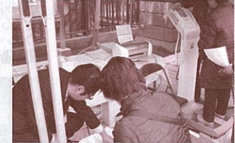
(株)タニタの体脂肪測定!