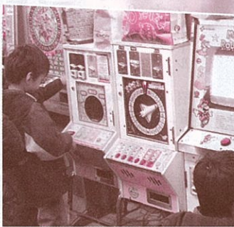
10円玉ゲーム機に驚きの子どもたち