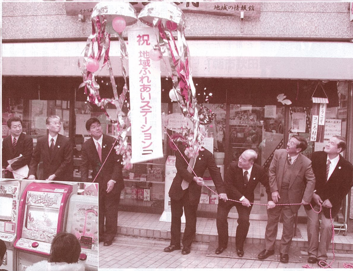
※ゲーム博物館は平成17年度の第1回空き店舗活用コンテスト「大賞」受賞アイデアです。