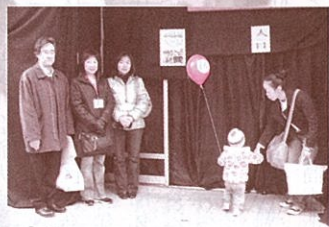
リンテック(株)の協力で、志村第一小作品展の夜の森出現

ゲーム博物館。ゲーム機収容30台は日本一で、NHKテレビで報道され全国からの集客も期待しています。当日は板橋iiプロジェクトの地元企業・町会・学校との連携イベントの、大きなパワーに支えられた地域コミュニティ一拠点の式典でした。