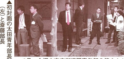
▲初対面の太田青年部長(左)と斎藤部長