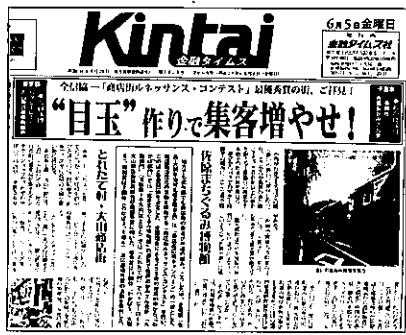
金融タイムスの6月5号の1面に掲載された

全国信用金庫協会の商店街応援キャンペーンの一環として、商店街ルネッサンス・コンテスト大樹部門での最優秀賞は、活動費1千万円以上が対象。ハッピーロード大山は、店街の地域ぐるみの活動を応援する金融機関から見て、地方と連携し双方の活性化に努めていることが評価され、255件中、最優秀賞を獲得。人との交流で産地訪問や修学旅行生の受け入れ、産地野菜の小中学校への提供、お客様の声を聞いて産地に返すを継続。次の企画も計画中という。※遊座は奨励賞受賞。