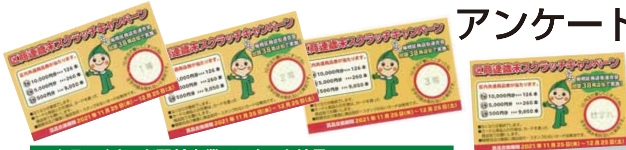
スクラッチカード配付事業アンケート結果(回答数34商店街)