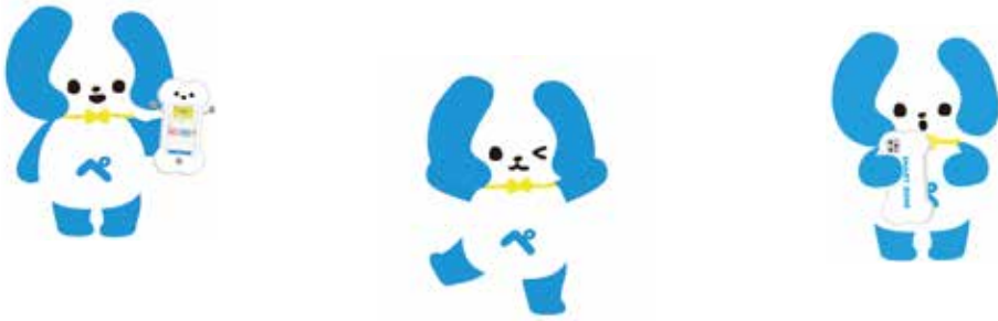
いたばしPay決済額・チャージ金額

令和4年度に始まった「いたばしPay」も今年度で4年目を迎えました。今年度の事業概要についてお知らせします。 現在のいたばしPayアプリのダウンロード数は約22万7000件になりました。 また、いたばしPayの加盟店舗数は、約2100店になっています。このうち、板橋区商店街連合会の会員店舗数は約700店舗ですが、その各月の決済額は、非加盟店舗の5〜10倍以上となっており、会員店舗が「いたばしPay」の事業継続に大きく寄与しているという結果になっています。 令和8年の3月前半までの「いたばしPay」のチャージ金額は約129億5000万円でした。そして実際に使われた金額は、約145億5000万円です。昨年との同時期と比較すると約40億円の増加となっています。月毎のチャージ金額と使われた金額は下記の表の通りです。 今年度は、6月、8月、12月に最大15%の利用者還元キャンペーンを実施しました。また、十月には最大25%還元率の「しょうれんいたばしPayまつり」を実施し、会員と非会員とで還元率を大きく変えて行いました。 更に、令和8年2月にも最大20%還元率のキャンペーンを行い、年間で計5回の利用者還元キャンペーンを実施しました。 令和8年度についても、7年度と同様に4回程度の利用者還元キャンペーンを実施する予定です。 板橋区商店街連合会会員の皆様には、非会員より高い還元率でのキャンペーンも実施予定で、また、令和7年10月から開始した換金手数料の徴収においても個店の場合、その徴収率が0.3%と加盟店舗の中で一番低く設定されていますので、このメリットを活かして「いたばしPay」への加盟店舗の増加にご協力をお願いいたします。