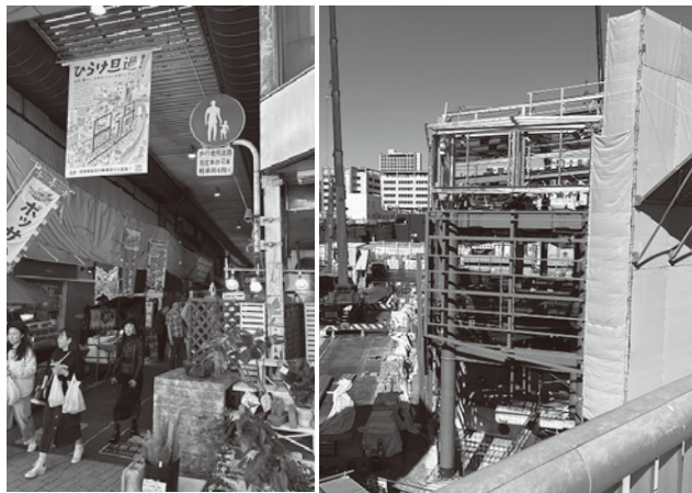
参加者からは、復興完成後の状況について、再度視察をしたいとの感想もありましたので、今後の検討課題したいと思います。

現在は、行政の協力や市民の皆さんのアイデアも頂いて、区画整理事業を実施し、また大学の学部誘致に成功し、令和8年の完成に向け工事が進んでいる状況です。